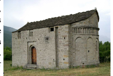
San Juan de Busa. image C.Mérigot, 2003

Un peu après l'an mille, toute une série d'églises au style tout à fait particulier, et remarquable par sa simplicité, sa beauté et l'utilisation des ressources locales, a été construite dans le Serrablo, une petite région du Haut Aragon, située autour de Sabiñanigo. La plus au sud de toutes ces églises est celle de Nasarre, mais la plupart sont plus au nord. Toute cette année 2018, l'office du tourisme du Haut Gállego, à Sabiñanigo, organise, les samedis, de 18 h à 20h, des visites guidées à trois d'entre elles, parmi les plus caractéristiques : San Pedro de Larrede, San Juan de Busa et celle d'Olivan. Bien sûr chacun peut les visiter individuellement et en visiter d'autres, toute l'année, cependant comme il est parfois difficile de savoir qui en conserve la clé, autant profiter de l'offre de l'Office du Tourisme pour ces trois-là.