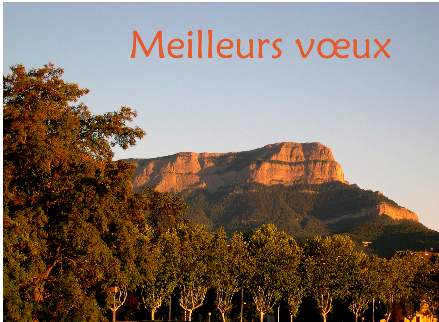
la Peña de Oroel, depuis Jaca

(en cliquant sur l'adresse ci-dessus, vous accéderez directement au site)