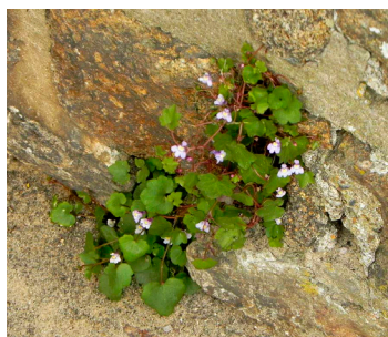
Une cymbalaire au salon de Saint-Malo (mai).