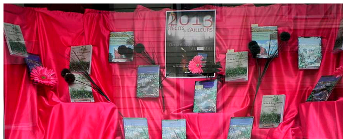
«La ramonda en Amérique» : toute une vitrine de librairie consacrée là-bas à nos livres ! Maisons à Saint-Pierre-et-Miquelon (avril).